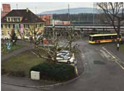
IST-Zustand: Bushof Muttenz (Haltestellen) mit dahinterliegendem SBB-Perron, Zufahrt MIV, Taxistandplätzen etc.