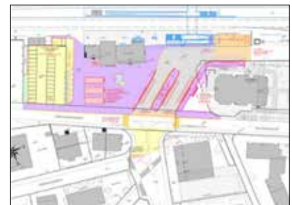
Bestvariante: Situationsplan des Bushofs