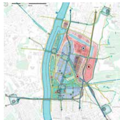
Mobilitätskonzept aus Stadtteilrichtplanung