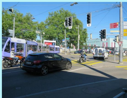
Foto Guisanplatz Richtung BEA

Ergänzend wurden in einem mittel- und langfristigen Ausblick Massnahmen skizziert und die gegenseitigen Abhängigkeiten und Nutzen aufgezeigt.