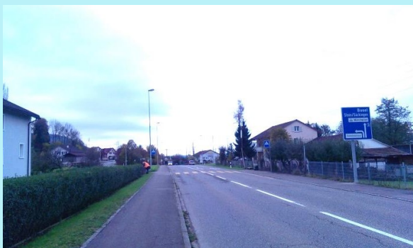
Bereich neue Bushaltestelle: Bestand